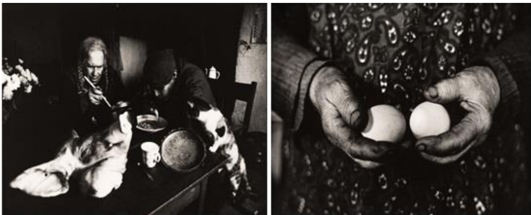
Zeldzame mensen (1974) © Toon Michiels / Nederlands Fotomuseum

De schenking omvat ca. 8300 negatieven en bijbehorende contactafdrukken, ca. 4250 dia's, ca. 550 kleuren- en zwart/witafdrukken, polaroids, agenda's, collages in sigarendoosjes en boeken.