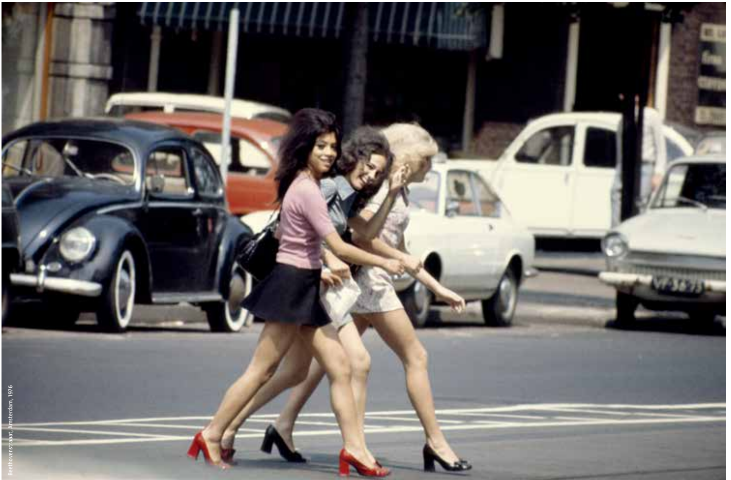
Beethovenstraat, Amsterdam, 1976