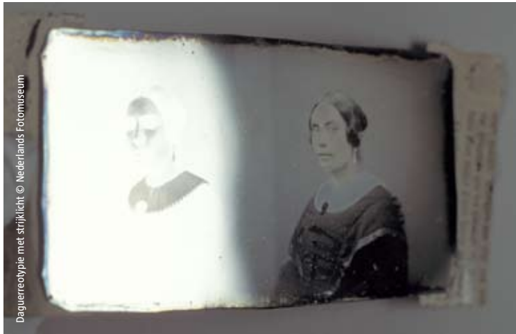
Daguerreotypie met strijklucht