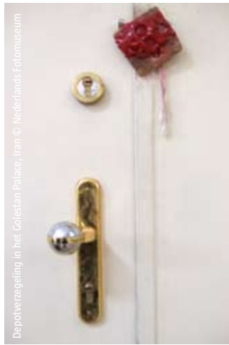
Depotverzegeling in het Colestan Palace, Iran