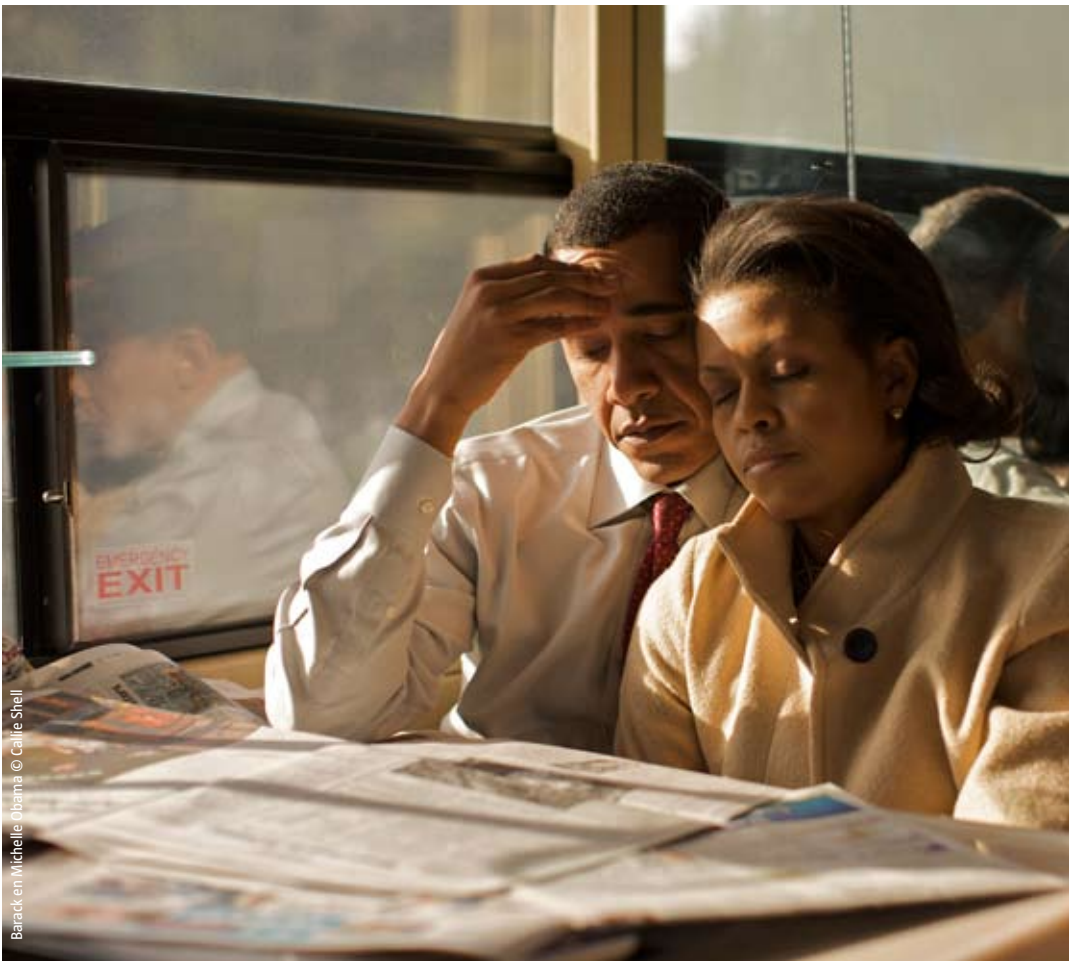
Barack et Michelle Obama