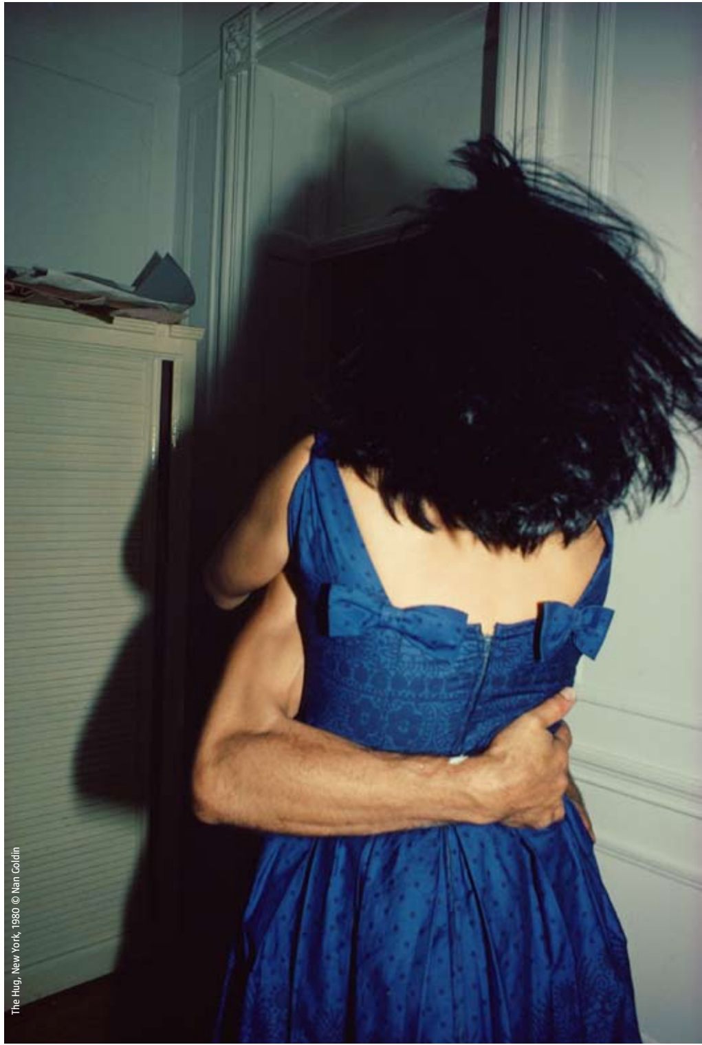
The Hug, New York, 1980 © Nan Goldin