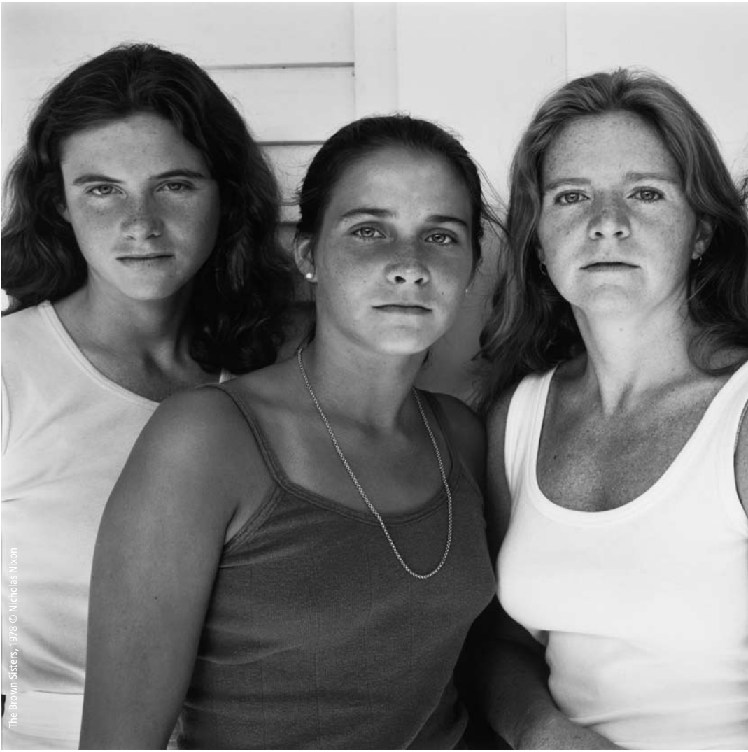
The Brown Sisters, 1978