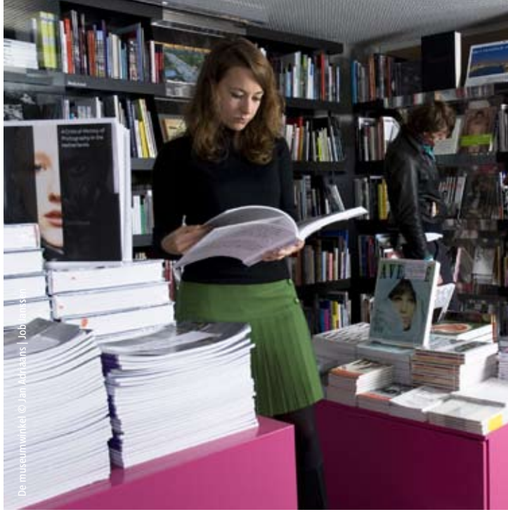
De museumwinkel