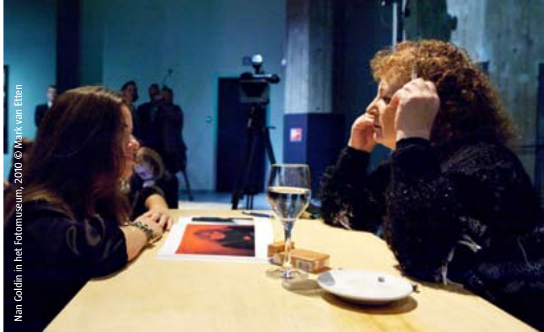
Nan Goldin in het Fotomuseum, 2010