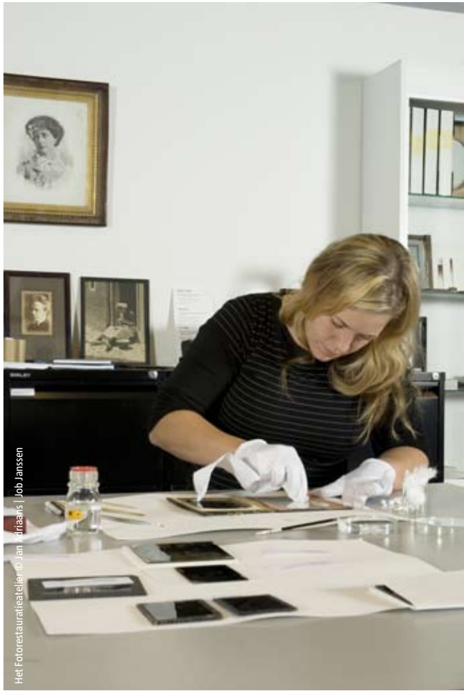
Het Fotorestaureerteller