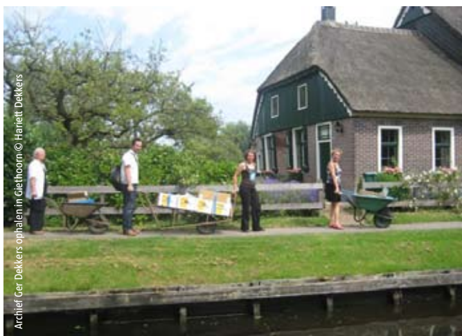
Archief Ger Dekkers ophalen in Giethoorn