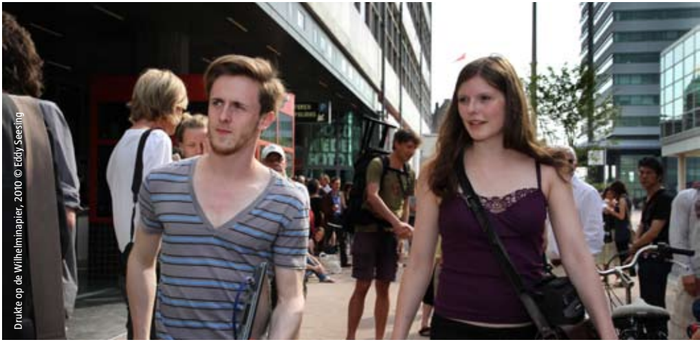
Drukta op de Wilhelmijnplein, 2010