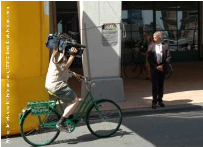
Pers op de fiets voor het fotomuseum, 2010